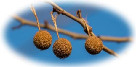
北三条通りの街路樹のプラタナス(スズカサキ)

古代ギリシア哲学者のソクラテスやプラトンなどは、プラタナスの木陰で弟子たちに講義をしたそうです。花言葉は「天才」「好奇心」。