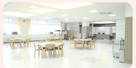
■デイサービスセンター食堂・機能訓練室