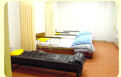
静養室 お昼寝やお疲れの時などに、横になってゆっくり休息できる静養室をご用意しています。