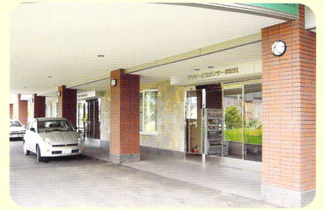
玄関前 車の乗り入れができるゆとりのスペース。

清潔で明るい雰囲気にあふれる真新しい施設では、お年寄りたちが快適に過ごせる各種設備が充実しています。