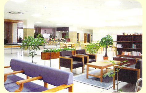
談話コーナー ゆとりの時間をお過ごしいただけます。