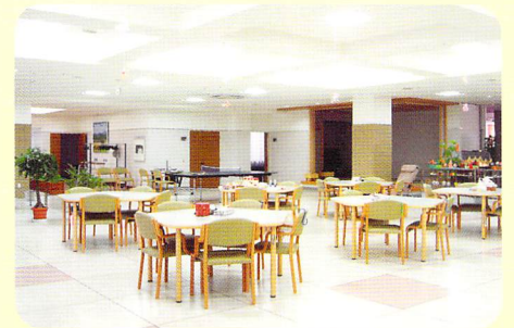
食堂 みんなでお食事を楽しめるゆとりのスペース。