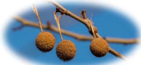
北三条通りの街路樹のプラタナス(スズカサキ)

古代ギリシア哲学者のソクラテスやプラトンなどは、プラタナスの木陰で弟子たちに講義をしたそうです。花言葉は「天才」「好奇心」。